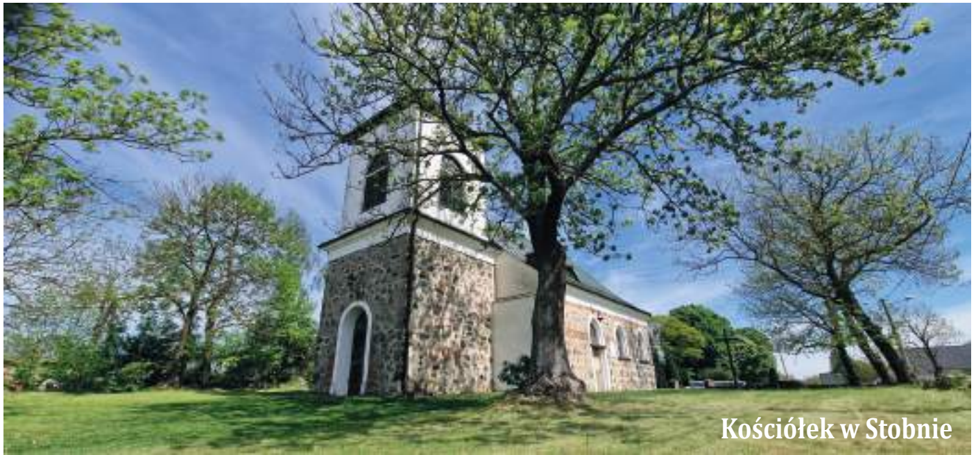
Kościółek w Stobnie

1277 - w tym roku Barnim I uposaża klasztor cysterek w Szczecinie 100 łanami ziemi w Przeclawiu