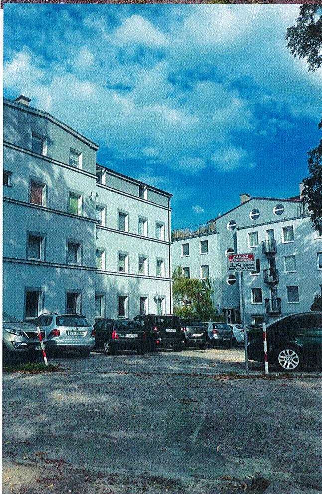
2. Zapelniony parking przed blokami