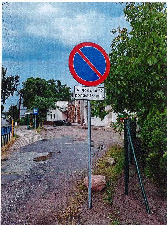
1. Zdjęcie drogi z zakazem postoju