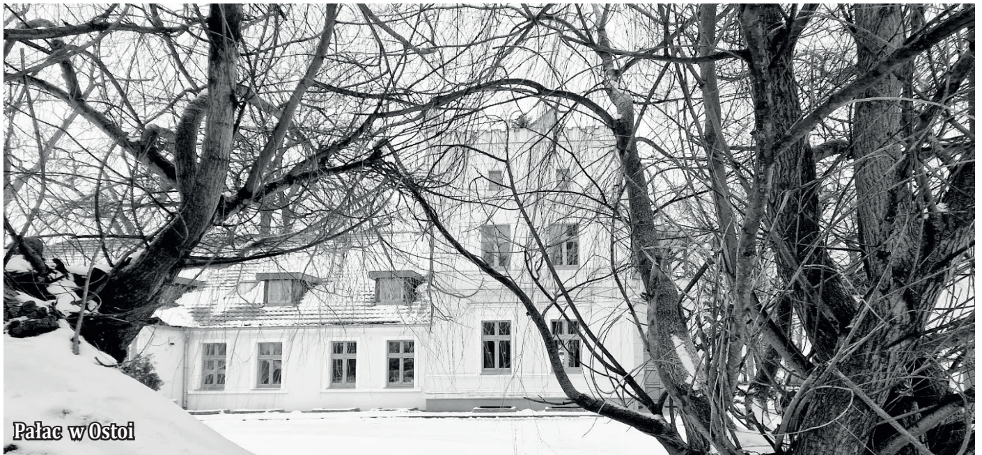
Pałac w Ostoi

407 - tyle osób mieszkało we wsi Kamieniec w 1874 roku. A w 1939 było ich mniej - 342