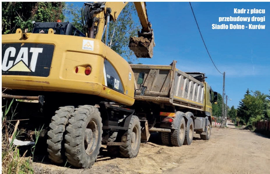
Kadr z placu przebudowy drogi Siadło Dolne - Kurów

Prace mają zakończyć się w pierwszej połowie 2025 roku. Wykonuje je spółka Musing Bud z siedzibą w Szczecinie. Ich koszt to 8 mln zł. Dodajmy, że Gmina Kołbaskowo otrzymała 3,2 mln zł dofinansowania z Funduszu Rozwoju Dróg.