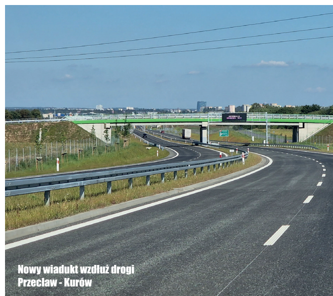
Nowy wiadukt wzdłuż drogi Przeclaw - Kurów