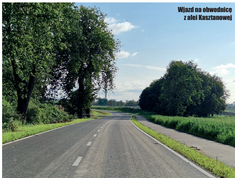
Wjazd na obwodnicę z alei Kasztanowej