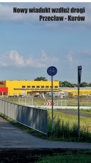
Nowy wiadukt wzdłuż drogi Przeclaw - Kurów