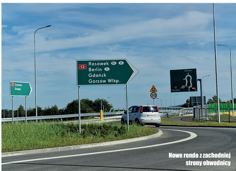
Nowe rondo z zachodniej strony obwodnicy