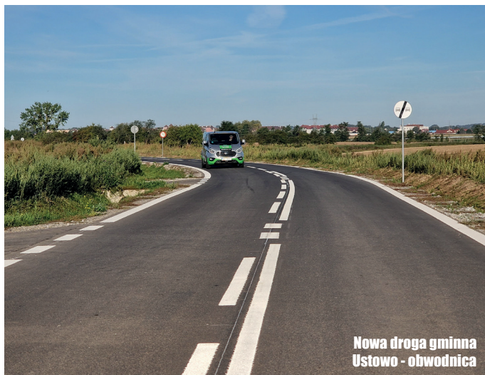
Nowa droga gminna Ustowo - obwodnica