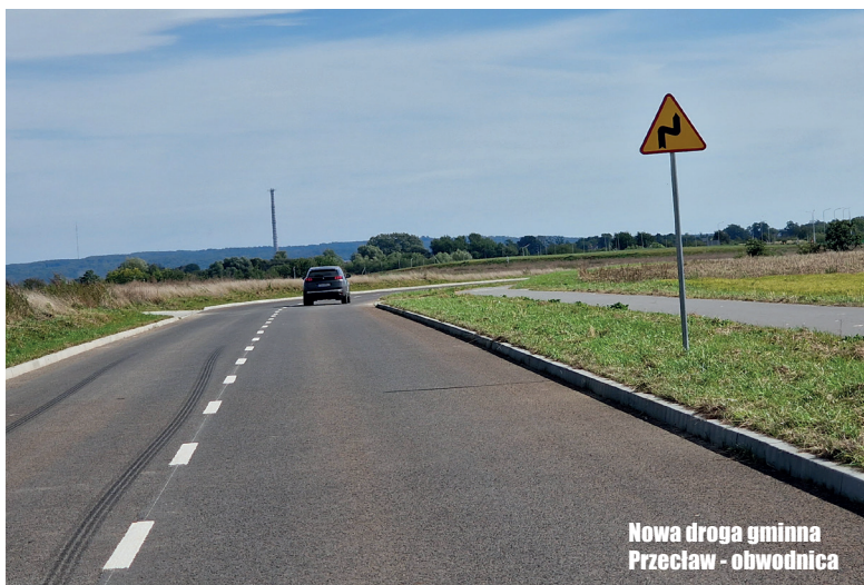
Nowa droga gminna Przeclaw - obwodnica