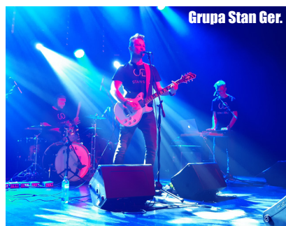
Grupa Stan Ger.

Rywalizacja toczy się w dwóch kategoriach: przestrzeń publiczna oraz obiekt użyteczności publicznej. W tegorocznej edycji konkursu konkuruje ze sobą 18 przedsiębiorstw z gmin: Barlinek, Bobolice, Darłowo, Drawno, Gryfice, Kobyłanka, Kołbaskowo, Postomino, Sławno, Świdwin i Świnoujście, które ukończone zostały w 2019 roku. Wręczenie nagród odbędzie się na przełomie września i października br. Dodajmy, że w ubiegłym roku w gronie zwycięskich samorządów znalazł się Szczecinek za pomost na jeziorze Trzesiecko oraz wspólne przedsięwzięcie zrealizowane w gminie Dobra „Dom Kota”, którego udziałowcem jest także Gmina Kołbaskowo. Komisja konkursowa wyróżniła też inwestycję w Siadle Dolnym i „Ptasi Zakątek” w Dołujach.