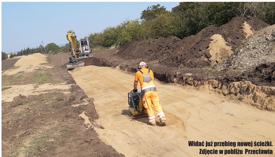
Widać już przebieg nowej ścieżki. Zdjęcie w pobliżu Przeclawia

Nowy szlak będzie miał 2,5 km długości i 3 m szerokości. Rozpocznie się w pobliżu