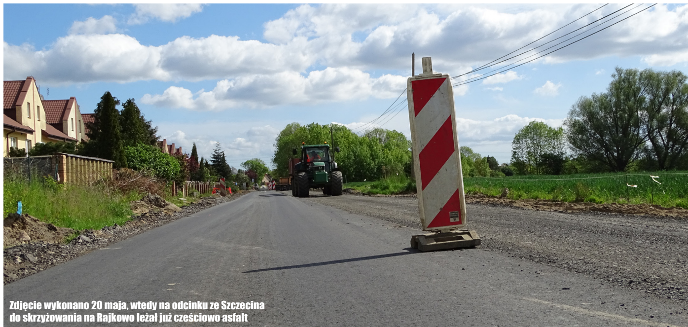
Zdjęcie wykonano 20 maja, wtedy na odcinku ze Szczecina do skrzyżowania na Rajkowo leżał już częściowo asfalt