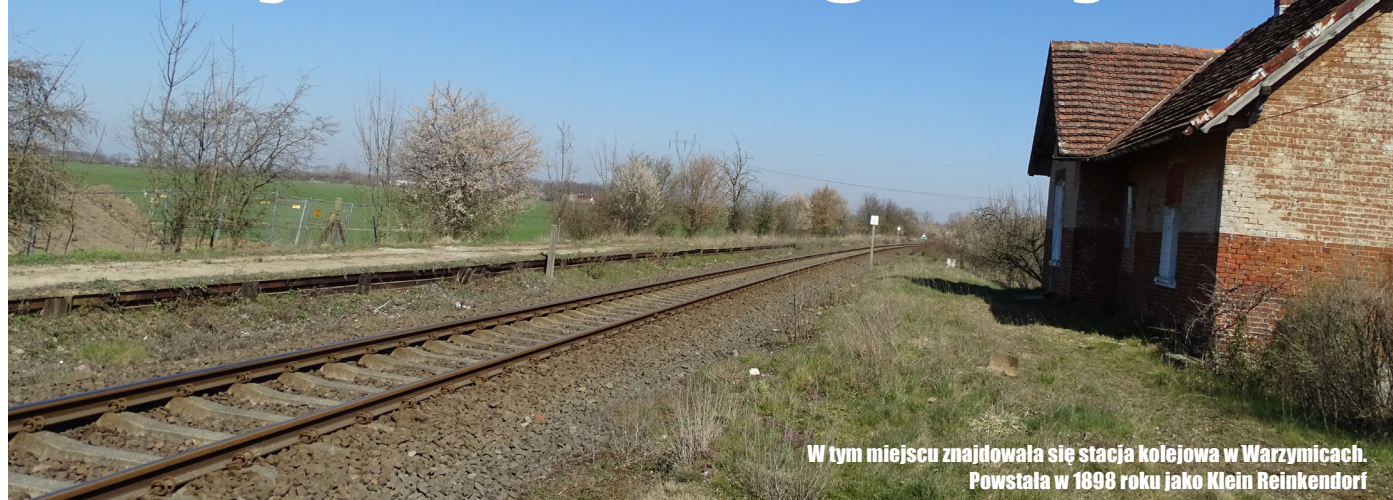
W tym miejscu znajdowała się stacja kolejowa w Warzymicach. Powstała w 1898 roku jako Klein Reinkendorf

200 przystanków kolejowych w całej Polsce, w tym dwa w Gminie Kołbaskowo (Przeclaw - Warzymice i Kołbaskowo) oraz kolejny na granicy naszej gminy i Szczecina – to założenie rządowego Programu przystankowego 2020 – 2025