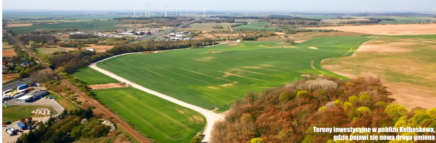
Tereny inwestycyjne w pobliżu Kołbaskowa, gdzie pojawi się nowa droga gminna

3 mln 942 tys. złotych dofinansowania na budowę nowej drogi gminnej otrzymała Gmina Kołbaskowo z Funduszu Dróg Samorządowych. To będzie droga do terenów inwestycyjnych, powstanie w pobliżu Kołbaskowa, wzdłuż A6. Jakie szlaki mogą się jeszcze pojawić?