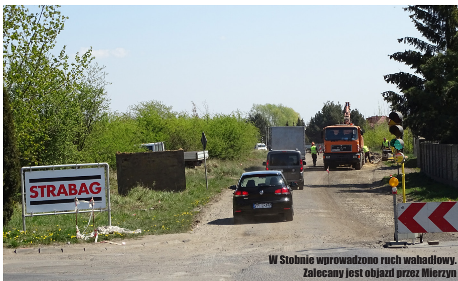
W Stobnie wprowadzono ruch wahadłowy. Zalecany jest objazd przez Mierzyn

- Tak, na odcinku od skrzyżowania na Rajkowo do Stobna na ukończeniu są prace związane z wykonaniem projektowanej kanalizacji sanitarnej oraz deszczowej. W około 70% przebudowane zostały kolidujące odcinki infrastruktury elektroenergetycznej – mówił Łukasz Mielnik. - Teraz prowadzone będą prace związane z rozbiórką istniejącej nawierzchni i wykonaniem nowych