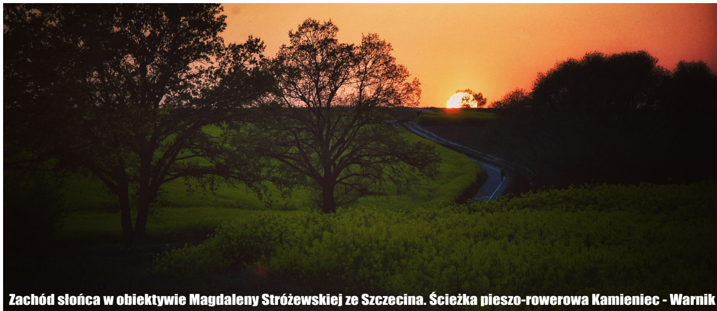
Zachód słońca w obiektywie Magdaleny Stróżewskiej ze Szczecina. Ścieżka pieszo-rowerowa Kamieniec - Warnik

4,40 zł, tyle kosztował kilka lat temu bilet kolejowy ze stacji Stobno Szczecińskie do Szczecina Głównego