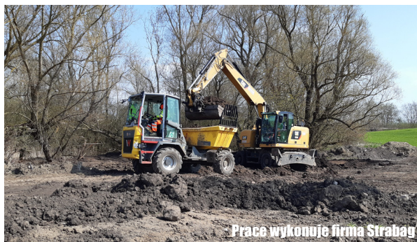
Prace wykonuje firma Strabag