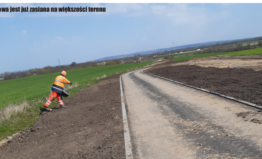
Trawa jest już zasiana na większości terenu