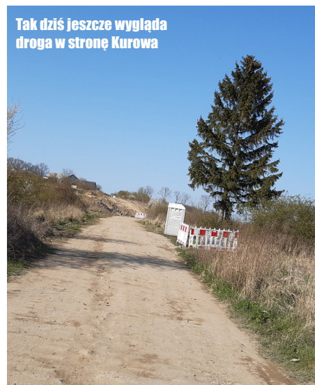
Tak dziś jeszcze wygląda droga w stronę Kurowa