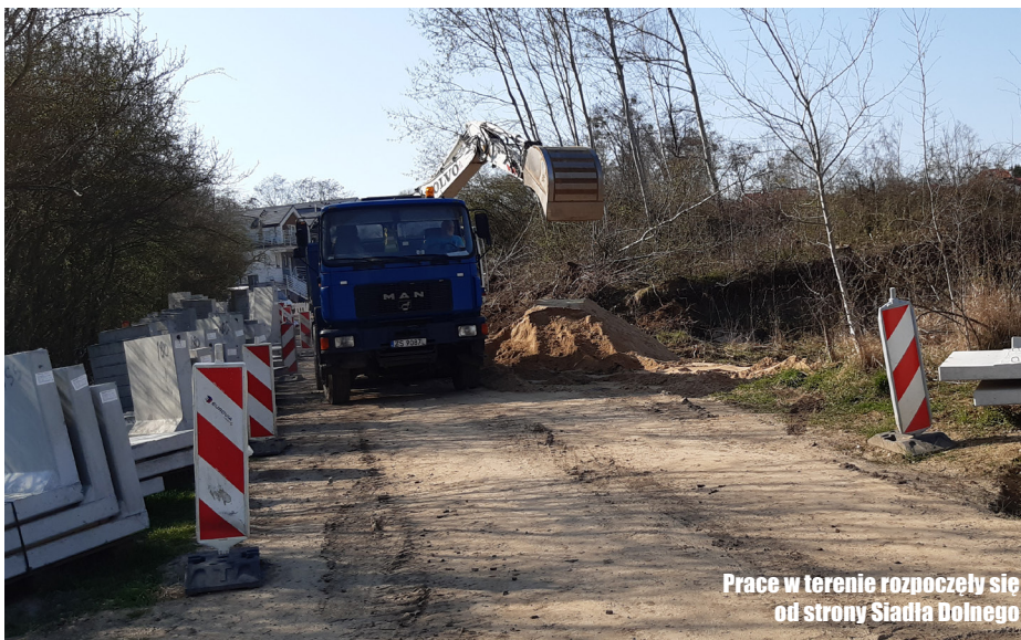
Prace w terenie rozpoczęły się od strony Siadła Dolnego

Z drogi i ścieżki wiodącej w górę, w stronę Kurowa, rozpościerają się przepiękne widoki na Odrę oraz Międzyodrzie. Dodajmy, że ścieżka rowerowa będzie przedłużeniem popularnego i lubianego w regionie Szlaku