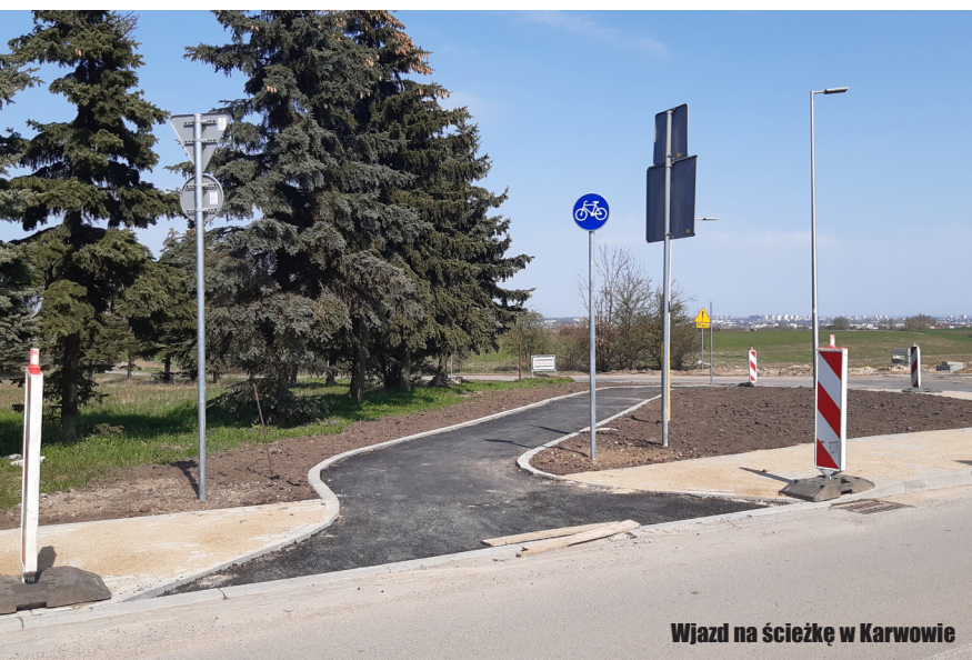
Wjazd na ścieżkę w Karwowie