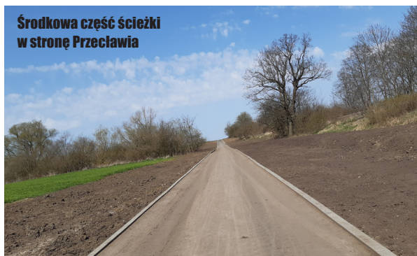
Środkowa część ścieżki w stronę Przecławia