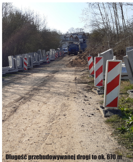
Długość przebudowywanej drogi to ok. 670 m