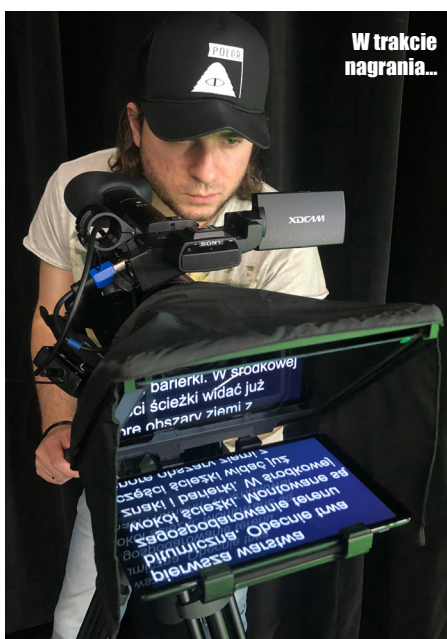
W trakcie nagrania...

ekranach, a tak naprawdę to nagrywamy na takim zielonym tle, na greenboxie, dlatego widzowie mogą mieć przeświadczenie, że mamy takie studio. Nie mamy, aczkolwiek możemy mieć każde studio jakie sobie wyimaginujemy.