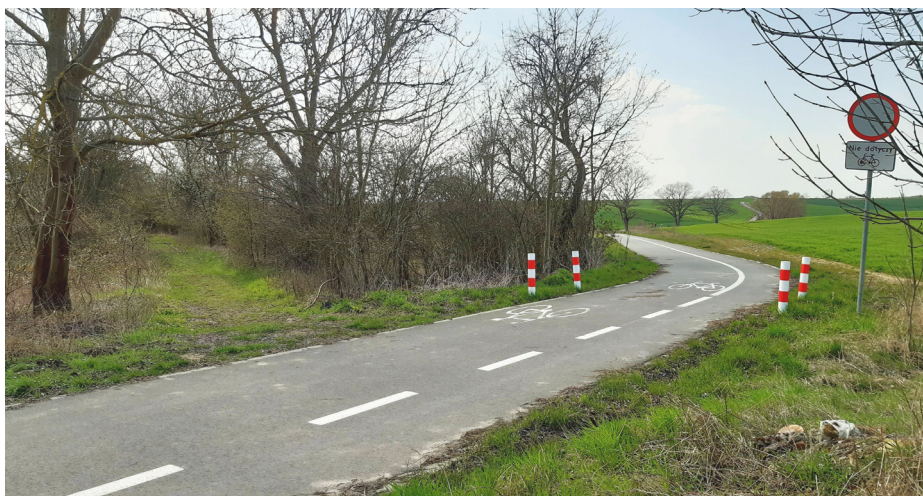
Na zdjęciu miejsce, w którym nowy szlak przetnie się z istniejącą ścieżką Karwowo - Warnik. W lewej części kadru widać miejsce, gdzie dawniej jeździły pociągi, a już niedługo pojawi się szlak rowerowy.

Temat budowy ścieżki po trasie dawnej kolejki wąskotorowej CPO (Casekow-Penkun-Oder) pojawił się w 2017 roku. Porozumienie pomiędzy Gminą Kołbasko-