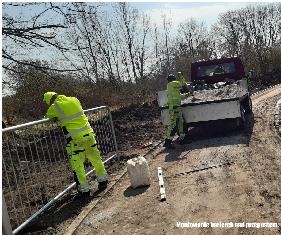
Montowanie barierek nad przepustem