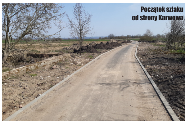
Początek szlaku od strony Karwowa