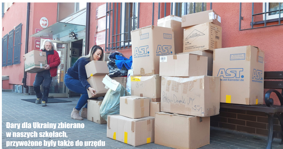
Dary dla Ukrainy zbierano w naszych szkołach, przywożone były także do urzędu