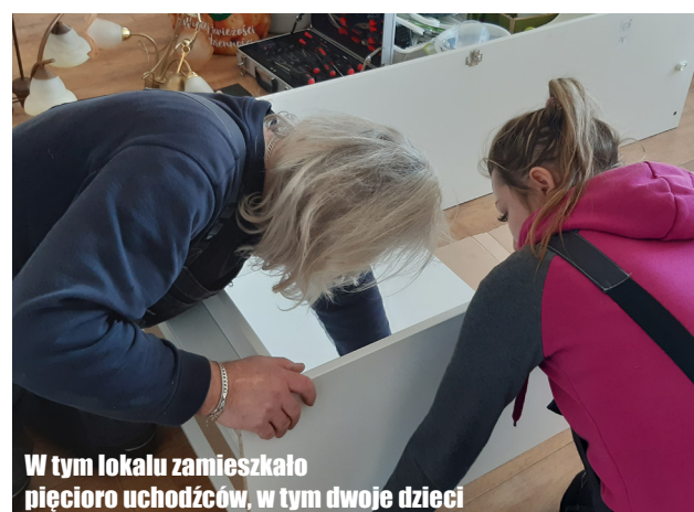
W tym lokalu zamieszkało pięcioro uchodźców, w tym dwoje dzieci