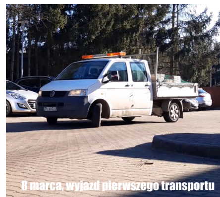
8 marca, wyjazd pierwszego transportu

Dodajmy, że władze Gminy Kołbaskowo wszelką pomoc konsultowały z przewodniczącym Związku Ukraińców w Szczecinie, Konsulem Ukrainy oraz Wojewodą Zachodniopomorskim.