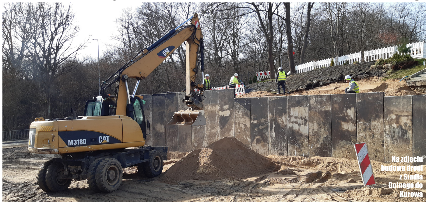
Na zdjęciu budowa drogi z Siadła Dolnego do Kurowa

Inwestycje drogowe na niespotykaną dotąd skalę realizowane są obecnie w naszej gminie. W sumie budowanych jest 9,4 kilometrów dróg za 119,9 mln zł. Gmina Kołbaskowo obecnie realizuje pięć inwestycji drogowych o długości 5,2 kilometrów za 30,4 mln zł. W planach są kolejne