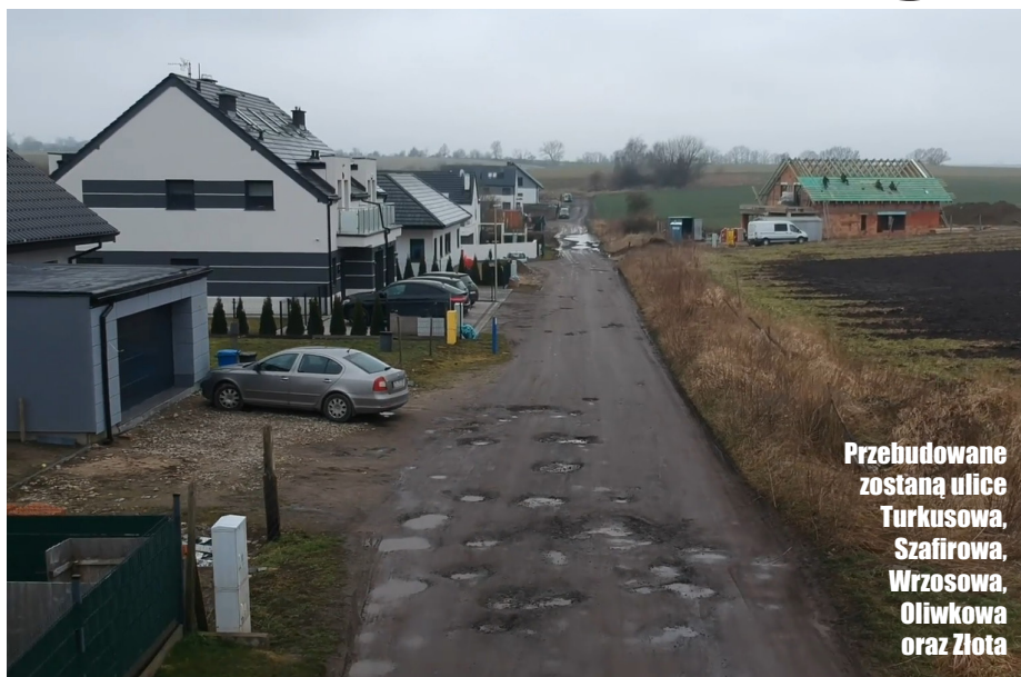
Przebudowane zostaną ulice Turkusowa, Szafirowa, Wrzosowa, Oliwkowa oraz Złota

Które ulice zostaną przebudowane? - Wszystkie znajdujące się pomiędzy Warzymicami a Karwowem. To ulice