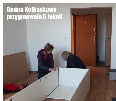
Gmina Kołbaskowo przygotowała 5 lokali

Akcja pomocy trwa. Szczegóły na facebooku Gminy Kołbaskowo – facebook.com/GminaKolbaskowo