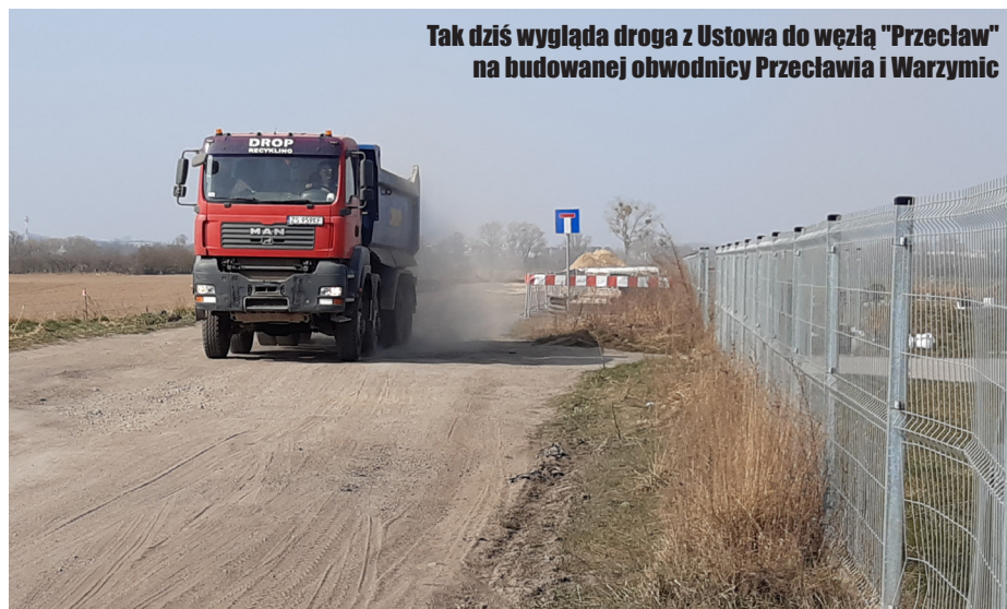
Tak dziś wygląda droga z Ustowa do węzła "Przeclaw" na budowanej obwodnicy Przeclawia i Warzymic

W tym roku rozpoczęły się kolejne dwie bardzo ważne inwestycje, budowa dróg gminnych Ustowo do węzła „Przeclaw” na obwodnicy oraz Ostoja – Szczecin.