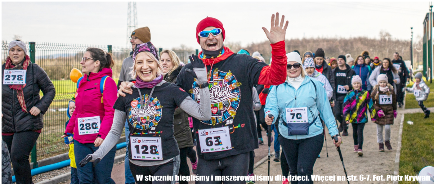
W styczniu biegliśmy i maszerowaliśmy dla dzieci. Więcej na str. 6-7.

8.324 złotych! Taką kwotę zebrano do puszek w niedzielę, 12 stycznia 2020 na terenie GOKSiR