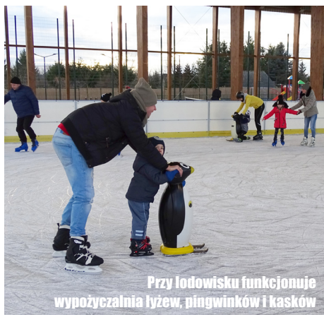
Przy lodowisku funkcjonuje wypożyczalnia łyżew, pingwinków i kasków