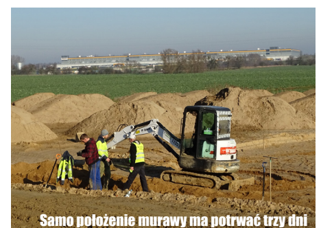
Samo położenie murawy ma potrwać trzy dni

Remont wykonywany na boisku jest darmową na rzecz Gminy Kołbaskowo.