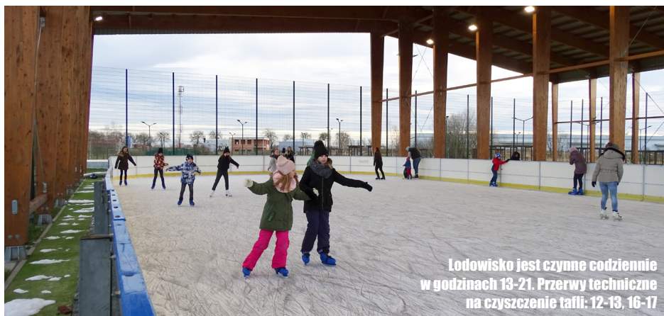
Lodowisko jest czynne codziennie w godzinach 13-21. Przerwy techniczne na czyszczenie tafli: 12-13, 16-17