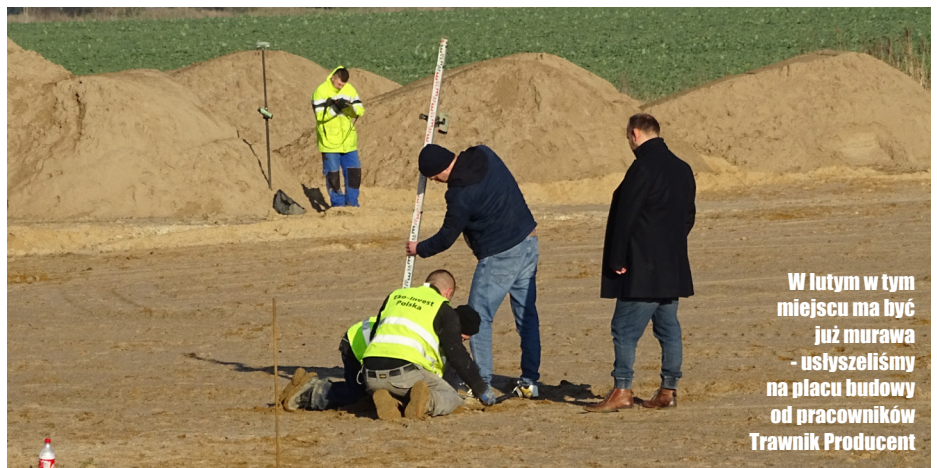
W lutym w tym miejscu ma być już murawa - usłyszeliśmy na placu budowy od pracowników Trawnik Producent