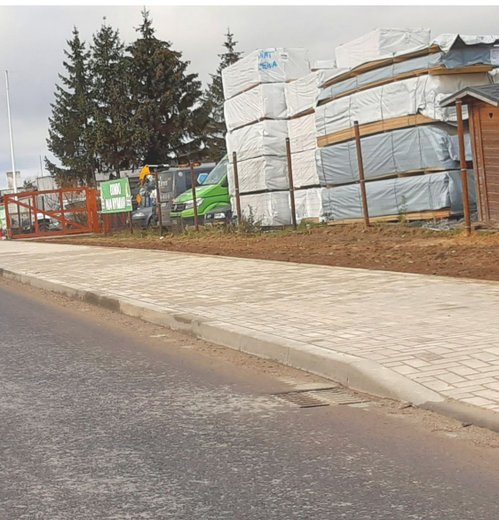
Droga Stobno - Szczecin, na zdjęciu Przyłep