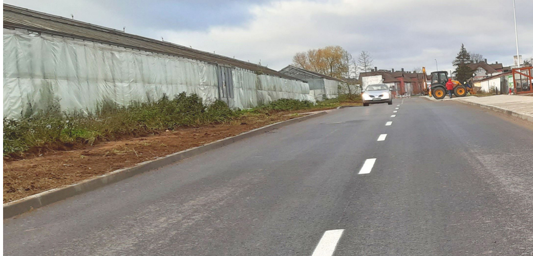
Ulica Cedrowa, czyli popularny skrót przez szklarnie

gdzie po deszczu woda stała na jezdni – dodaje pani wójt.