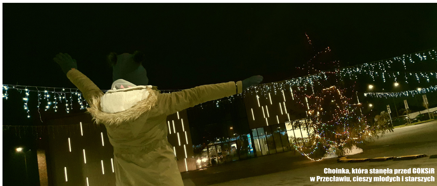
Choinka, która stanęła przed GOKSiR w Przecławiu, cieszy młodych i starszych

1240 - w tym roku pierwszy raz wzmiankowano Ustowo jako Wztoho, później Vztowa, Gustouue