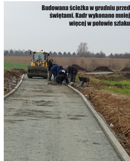
Budowana ścieżka w grudniu przed świętami. Kadr wykonano mniej więcej w połowie szlaku