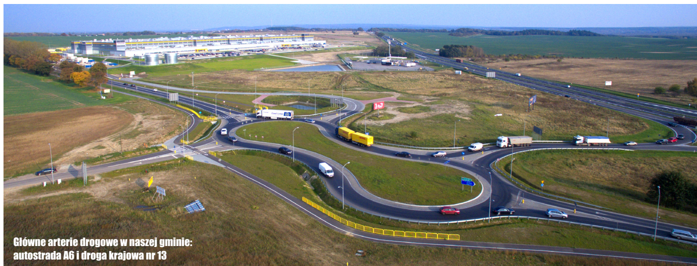
Główne arterie drogowe w naszej gminie: autostrada A6 i droga krajowa nr 13