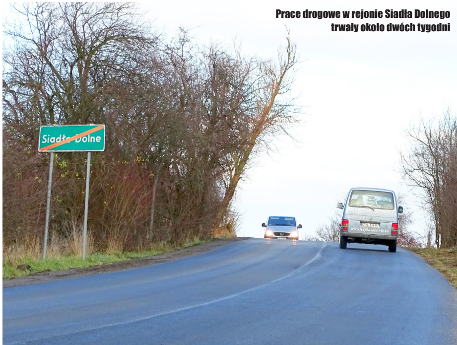
Prace drogowe w rejonie Siadła Dolnego trwały około dwóch tygodni

Przykładowo, nakładka w Kurowie położona została siedem lat temu i do dziś jest w dobrym stanie.