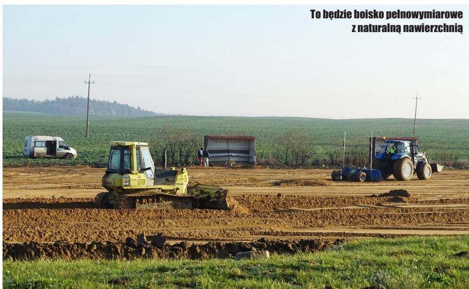
To będzie boisko pełnowymiarowe z naturalną nawierzchnią