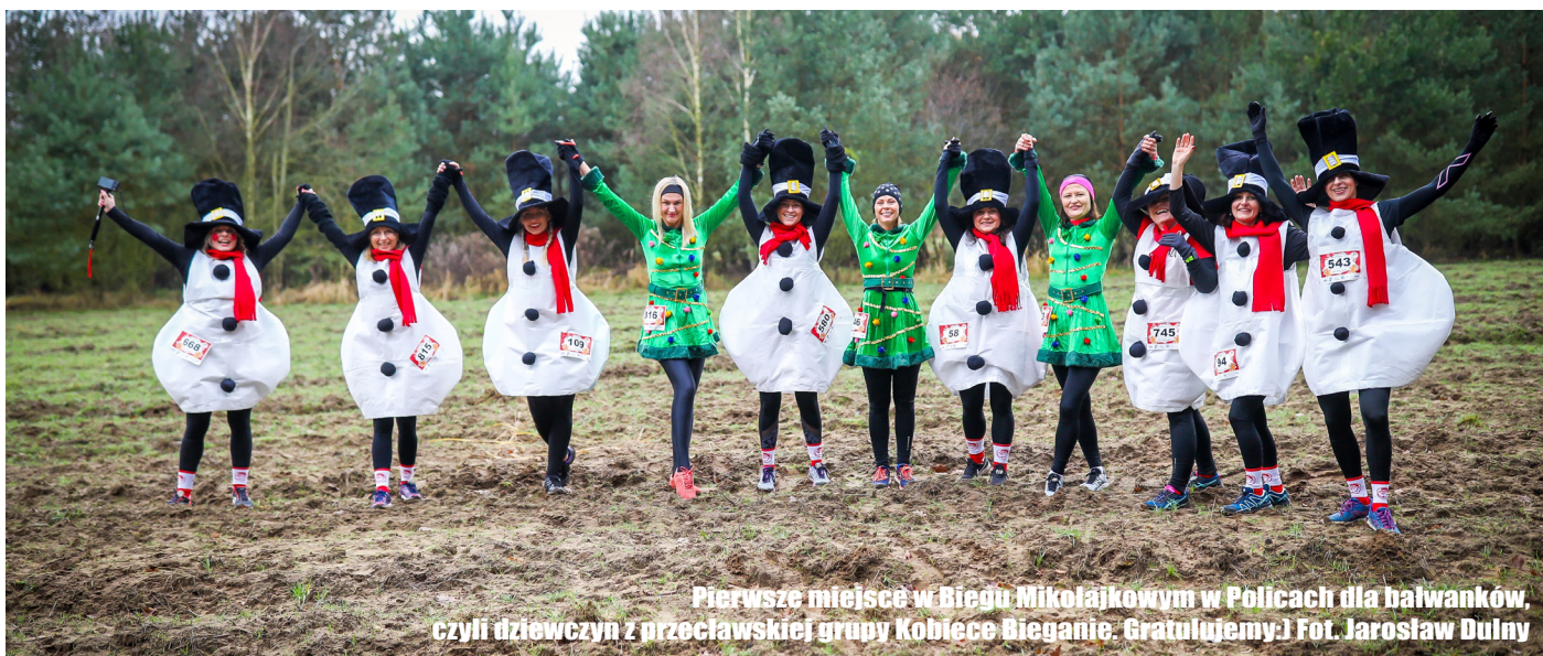
Pierwsze miejsce w Biegu Mikołajkowym w Policach dla bałwanków, czyli dziewczyn z przecławskiej grupy Kobięce Bieganie. Gratulujemy!

250 mln złotych. Tyle kosztuje budowany przez KION w Kołbaskowie zakład wraz z centrum badań