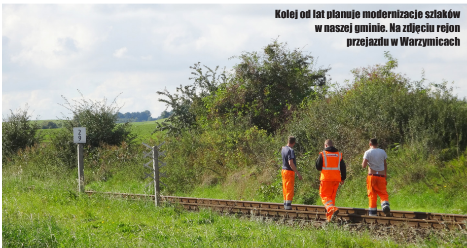
Kolej od lat planuje modernizację szlaków w naszej gminie. Na zdjęciu rejon przejazdu w Warzymicach

Studium wykonalności prezentować ma wariant budowy nowych przystanków w pobliżu Warzymic i Kolbaskowa, a także odbudowy linii nr 429 na odcinku Dołuje - Dobra wraz z przystosowaniem odcinka Stobno Szczecińskie - Dobra do obsługi ruchu aglomeracyjnego. Dałoby to możliwość włączenia w przyszłości tych wszystkich przystanków (a także stacji Szczecin Gu-