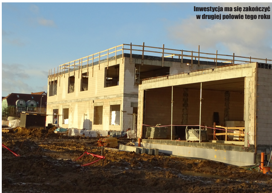
Inwestycja ma się zakończyć w drugiej połowie tego roku