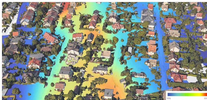
Pomiar stężenia PM10 w Szczecinie 11 grudnia 2018 roku, wykonany przez specjalistyczny dron.

- Taki dron do badania powietrza zwiększy nasze możliwości kontrolne – powiedział Łukasz Galczewski, komendant Straży Gminnej w Kołbaskowie. - Grzywna za palenie w piecach odpadami wynosi do 500 zł, a jeśli sprawa zostanie skierowana do sądu, sięga 5 tys. zł.