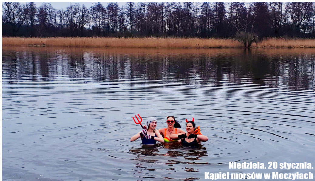
Niedziela, 20 stycznia. Kąpiel morsów w Moczylach

Wydawca: Gmina Kołbaskowo. Drukarnia: Soft Vision. Redakcja: Jarosław Dworzyński. Kontakt: Urząd Gminy Kołbaskowo, 72-001 Kołbaskowo 106. Mail: gazeta@kolbaskowo.pl . Redakcja nie zwraca niezamówionych materiałów.