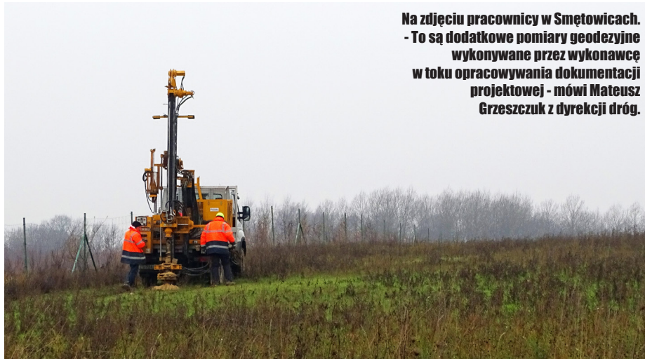
Na zdjęciu pracownicy w Smętowicach. - To są dodatkowe pomiary geodezyjne wykonywane przez wykonawcę w toku opracowywania dokumentacji projektowej - mówi Mateusz Grzeszczuk z dyrekcji dróg.

Nowa droga będzie miała 6,5 km długości. Będzie dwujezdniową drogą klasy GP (główna ruchu przyspieszonego). Rozpocz-