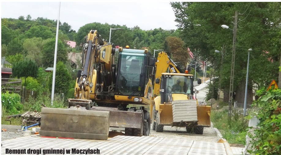
Remont drogi gminnej w Moczyłach

- Ponieważ ścieżka rowerowa jest przedłużeniem budowanej drogi gminnej w Karwowie, zostanie udostępniona rowerzystom dopiero po uzyskaniu pozwolenia na użyt-