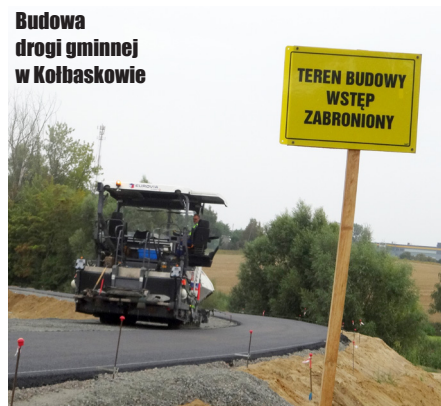
Budowa drogi gminnej w Kolbaskowie