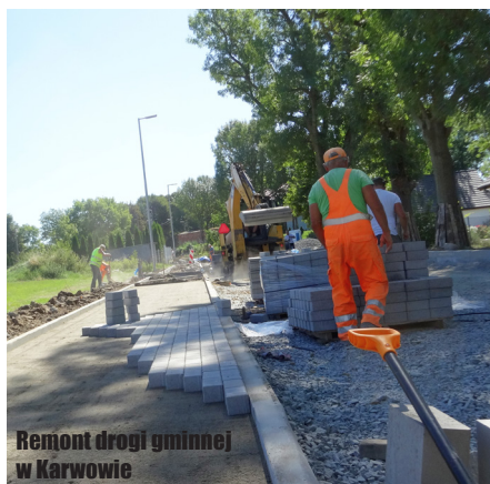
Remont drogi gminnej w Karwowie