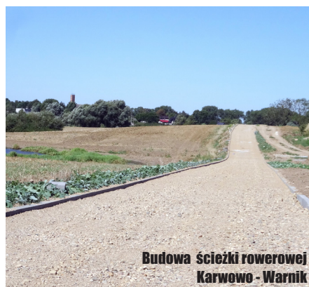
Budowa ścieżki rowerowej Karwowo - Warnik