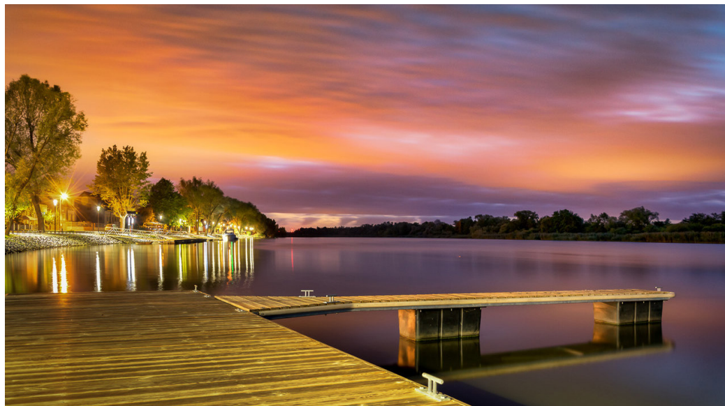
Piękny kadr Siadła Dolnego w obiektywie pana Romana Brzezińskiego z Polic. Pan Roman obiecuje więcej zdjęć. Szukajcie ich na profilu Gminy Kolbaskowo na facebooku. O oficjalnym otwarciu nabrzeża w Siadle Dolnym czytacie na stronie 4.

Wydawca: Gmina Kolbaskowo. Drukarnia: Soft Vision. Redakcja: Jarosław Dworzyński. Kontakt: Urząd Gminy Kolbaskowo, 72-001 Kolbaskowo 106. Mail: gazeta@kolbaskowo.pl . Redakcja nie zwraca niezamówionych materiałów.