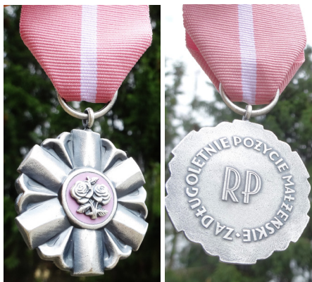
Takie medale otrzymali mieszkańcy naszej gminy

Rozmowa trwała jeszcze długo. A kolejne pary z naszej gminy, które wspólnie przeżyły 50 lat, zapraszamy do Referatu Spraw Obywatelskich w Urzędzie Gminy w Kołbaskowie.