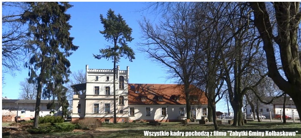
Wszystkie kadry pochodzą z filmu "Zabytki Gminy Kołbaskowo"