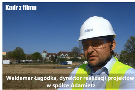
Kadr z filmu

rzystają z niej mieszkańcy Przecławia, Kolbaskowa, Warzymic i Szczecina” – donosiło Radio ESKA. „Mieszkańcy Przecławia i Warzymic doczekają się domu kultury (z bogatym zapleczem sportowym) z prawdziwego zdarzenia” – pisała Gazeta Wyborcza.