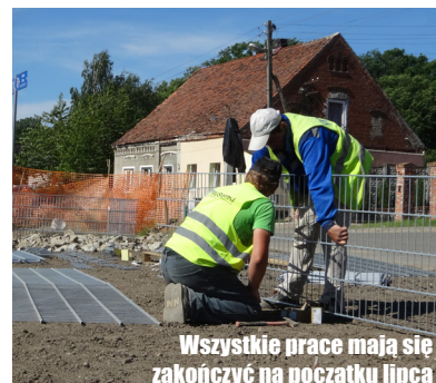
Wszystkie prace mają się zakończyć na początku lipca