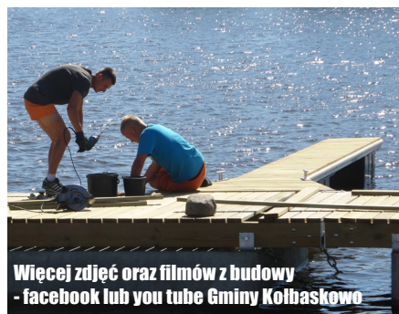
Więcej zdjęć oraz filmów z budowy - facebook lub you tube Gminy Kolbaskowo