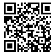
Zeskanuj kod i zobacz film