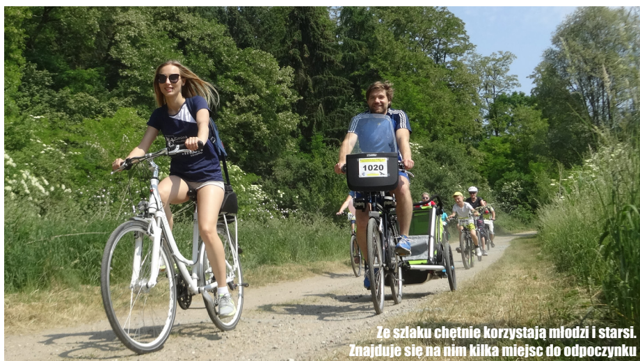
Ze szlaku chętnie korzystają młodzi i starsi. Znajduje się na nim kilka miejsc do odpoczynku