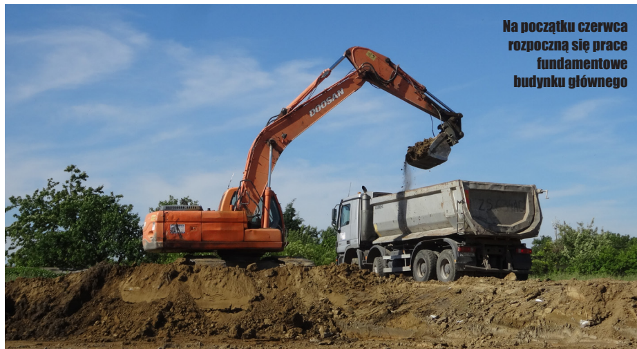
Na początku czerwca rozpoczną się prace fundamentowe budynku głównego