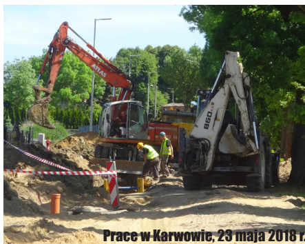
Prace w Karwowie, 23 maja 2018 r.

Od kilku miesięcy trwa przebudowa drogi gminnej w Moczyłach wraz z kanalizacją deszczową. Chodzi o główną drogę we wsi o długości 725 m. Rozpoczyna się koło symbolu Moczył – Łódki, a kończy tuż przy Odrze. Na długości 612 m położona zostanie nowa