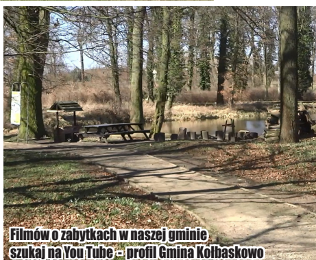
Filmów o zabytkach w naszej gminie szukaj na You Tube - profil Gmina Kołbaskowo