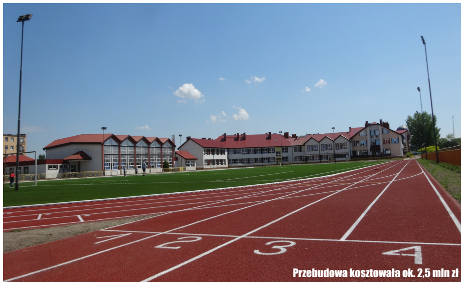
Przebudowa kosztowała ok. 2,5 mln zł

Zmodernizowano także boisko do piłki ręcznej (22m x 44m), gdzie zastosowano nawierzchnię z trawy syntetycznej o 20 mm wysokości włókna oraz do koszykówki (15m x 28m), gdzie pojawiła się nawierzchnia