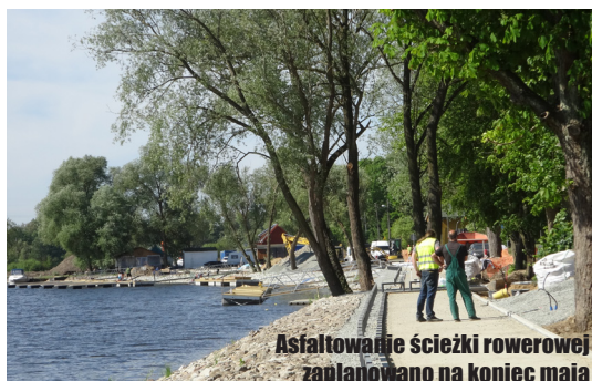
Asfaltowanie ścieżki rowerowej zaplanowano na koniec maja