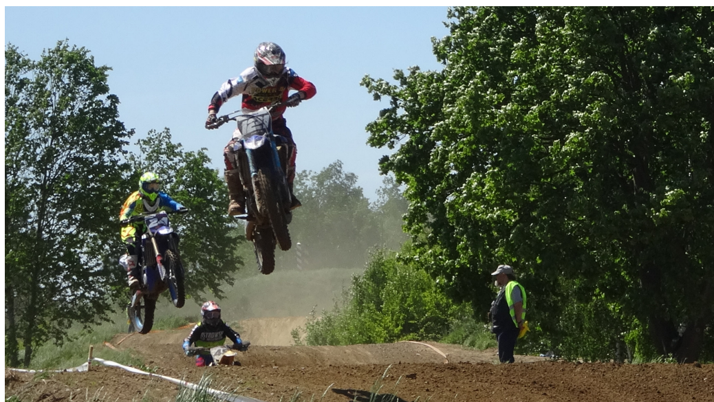
Mocne słońce, kurz, ryk motorów i setki widzów - tor motocrossowy w Rosówku był miejscem widowiskowych zawodów - III rundy Mistrzostw Polski Zachodniej. Kto był, nie żaluje:) Więcej zdjęć na facebook.com/pg/GminaKolbaskowo/photos

Wydawca: Gmina Kolbaskowo. Drukarnia: Soft Vision. Redakcja: Jarosław Dworzyński. Kontakt: Urząd Gminy Kolbaskowo, 72-001 Kolbaskowo 106. Mail: gazeta@kolbaskowo.pl . Redakcja nie zwraca niezamówionych materiałów.