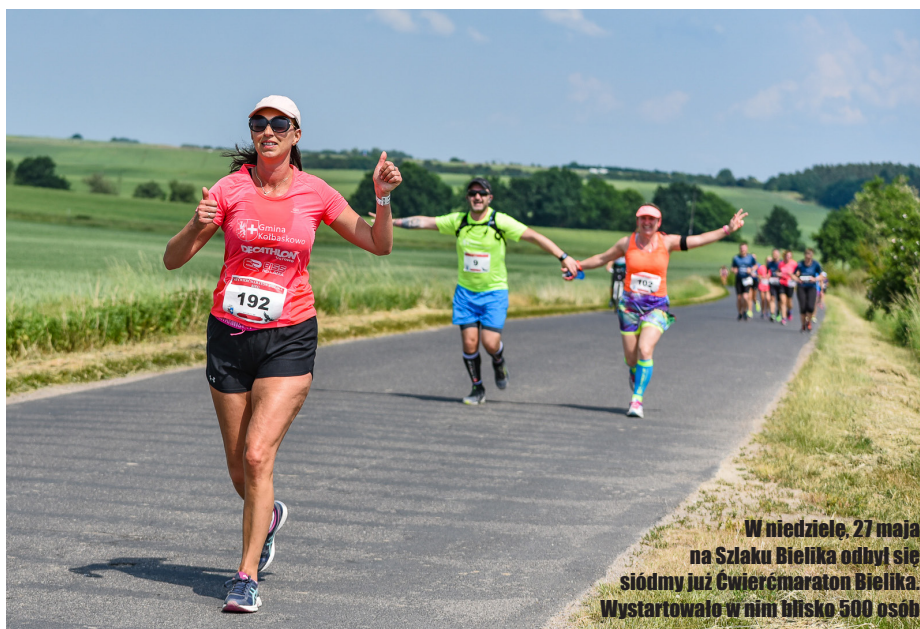
W niedzielę, 27 maja na Szlaku Bielika odbył się siódmy już Cwierzmaraton Bielika. Wystartowało w nim blisko 500 osób