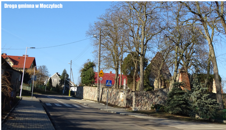
Droga gminna w Moczyłach

” Teraz może tu przyjeź- dzać na koncerty nad Odrą jeszcze więcej miłośników poezji śpiewanej