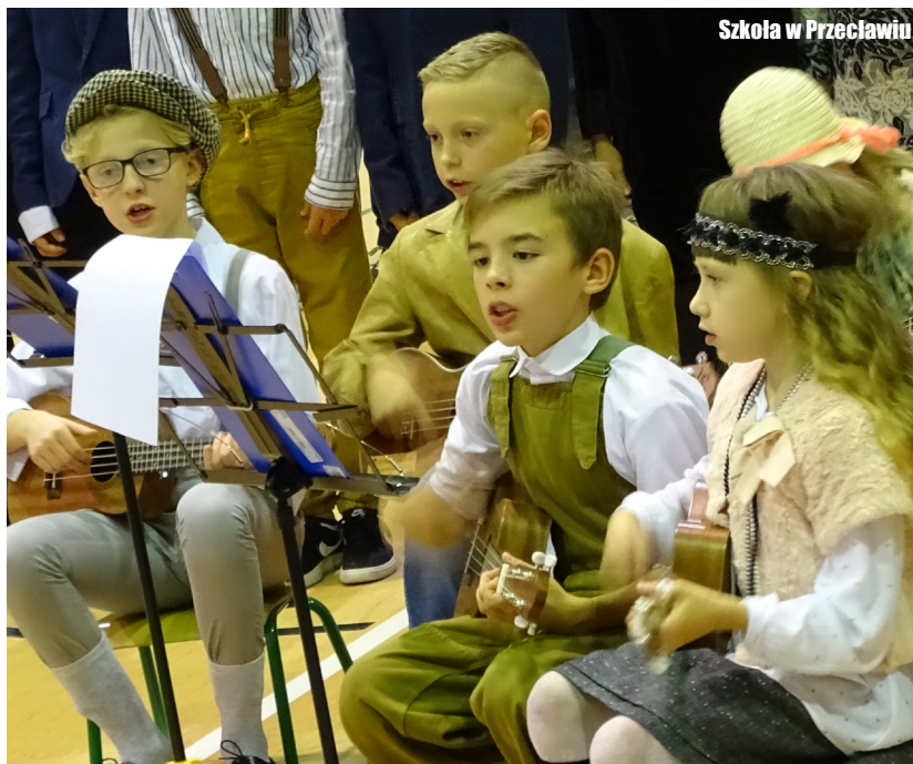
Szkoła w Przecławiu