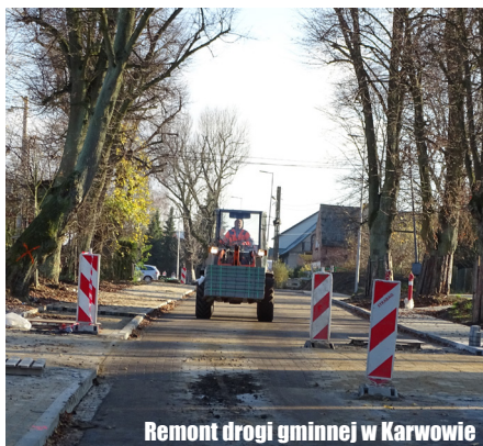
Remont drogi gminnej w Karwowie