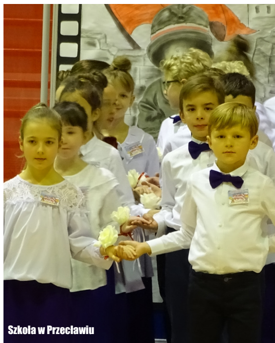
Szkoła w Przecławiu