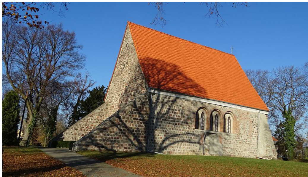
Urokliwy, zabytkowy kościółek w Będargowie w jesiennym, listopadowym słońcu.

Wydawca: Gmina Kołbaskowo. Drukarnia: Soft Vision. Redakcja: Jarosław Dworzyński. Kontakt: Urząd Gminy Kołbaskowo, 72-001 Kołbaskowo 106. Mail: gazeta@kolbaskowo.pl . Redakcja nie zwraca niezamówionych materiałów.