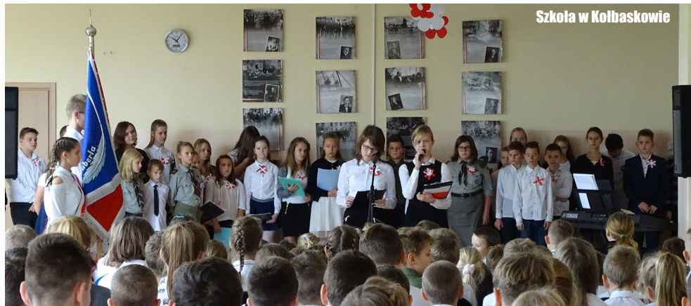
Szkoła w Kolbaskowie