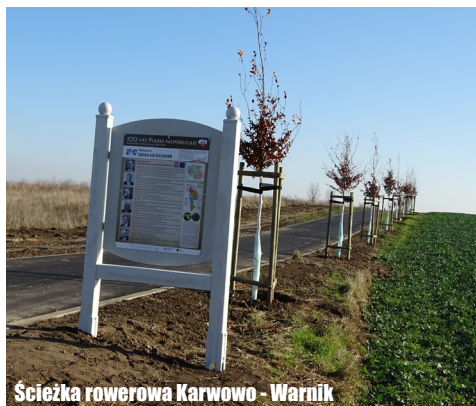
Ścieżka rowerowa Karwowo - Warnik

Koszt inwestycji to ok. 3 mln zł. Planowane jest przedłużenie tej drogi. Rozpocznie się tuż za przejazdem kolejowym i pobiegnie w stro-nę granicy. Jest już projekt inwestycji, a także decyzja ZRID (zezwoleń na realizację inwe-stycji drogowej).