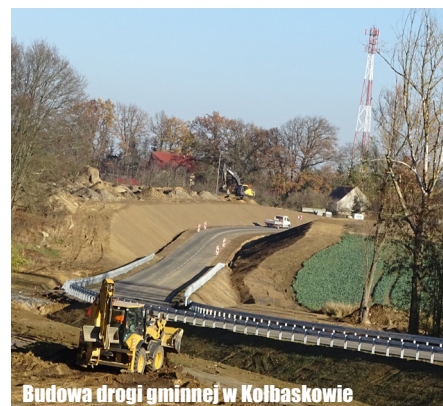
Budowa drogi gminnej w Kołbaskowie