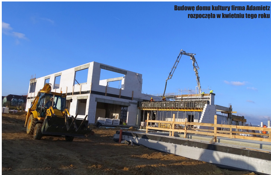
Budowę domu kultury firma Adamietz rozpoczęła w kwietniu tego roku