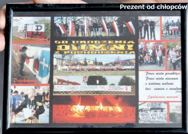
Prezent od chłopców z Gwardii Narodowej

Redakcja: Wracając do patriotyzmu. Patrząc na postawy patriotyczne obywateli Stanów Zjednoczonych mam wrażenie, że w Polsce ten patriotyzm mocno kuleje. Wystydymy się swojej narodowości. Za granicą matki urządzają dzieciom pokoje w barwach flagi amerykańskiej, a młodzież nosi trampki z gwiazdą, albo koszulki w barwach Brazylii... Jak przekazywać dzieciom postawę patriotyczną? >