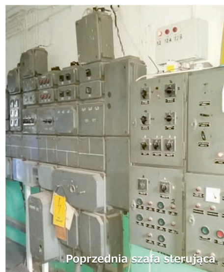
Poprzednia szafa sterująca