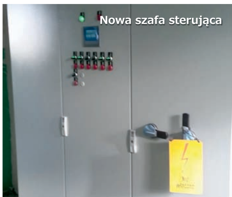
Nowa szafa sterująca