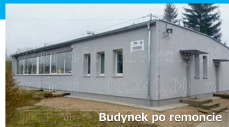
Budynek po remoncie