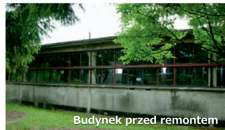
Budynek przed remontem