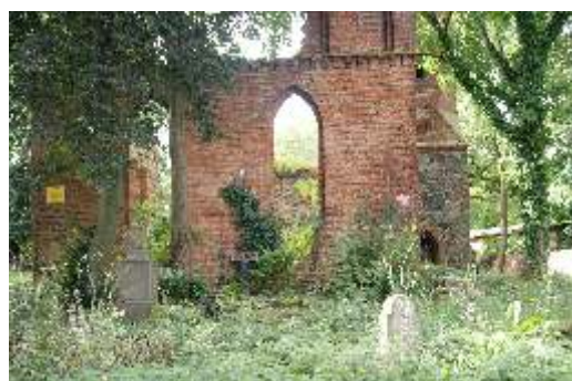
Kościół w Karwowie – widok współczesny