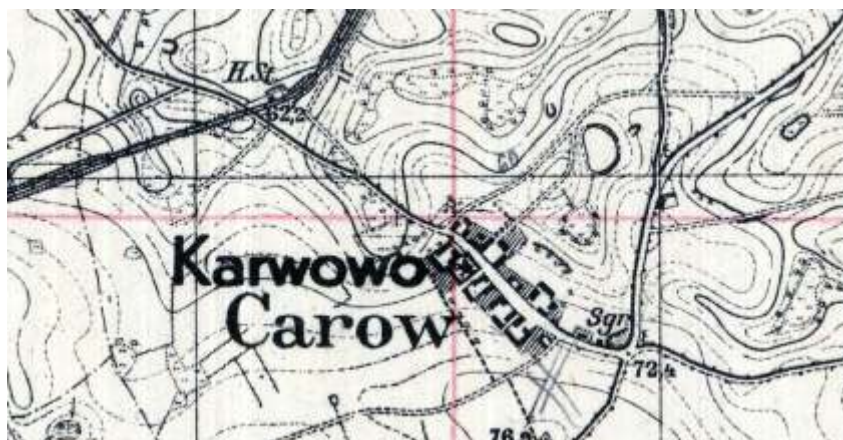
Karwowo na podkładzie mapowym z 1887 r.