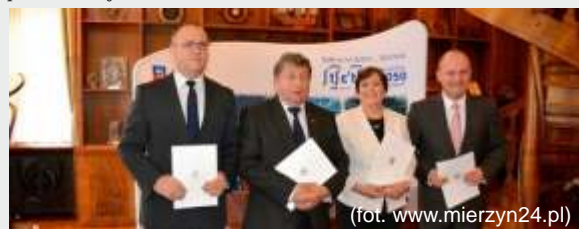
(fot. www.mierzyn24.pl )

Należy jednak zwrócić uwagę, że podpisanie porozumienia ramowego o przystąpieniu Gmin ze Szczecińskiego Obszaru Metropolitalnego do programu SPR stanowi pierwszy etap wdrożenia Karty na obszarze metropolitalnym. Kolejnym krokiem będzie podpisanie porozumienia między gminami a instytucjami miejskimi o współpracy przy realizacji programu. Gminy, zgodnie z porozumieniem, mają 6 miesięcy na sfinalizowanie formalności. O terminie składania wniosków o przyznanie Karty każda z gmin indywidualnie poinformuje swoich mieszkańców.