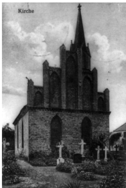
Kościół w Karwowie – widok przedwojenny

Współczesne Karwowo, skomunikowane ze Szczecinem autobusami miejskim, znane jest głównie z prowadzonego od roku 1981 przez Zgromadzenie Sióstr Benedyktynek Samarytanek Krzyża Chrystusowego Domu Samotnej Matki. Atrakcją turystyczną jest teren dawnej wiołwni, będącej doskonałym punktem widokowym na Szczecin oraz ruiny gotyckiego kościoła. Zainteresowaniem w dkarzy cieszy się również polny zbiornik wodny – rozlewisko między Karwowem a Barnisławiem.