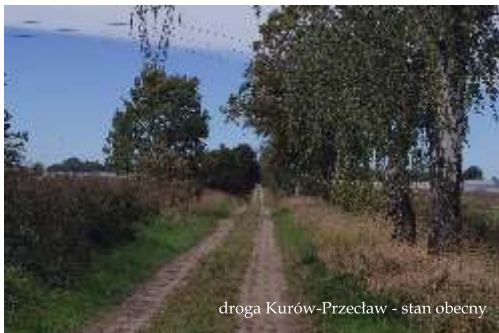
droga Kurów-Przeclaw - stan obecny

Niebawem połączymy Kurów z Przeclawiem. Oczywiście nie administracyjnie, lecz komunikacyjnie. Przetarg na budowę drogi Kurów-Przeclaw został już ogłoszony. Wkrótce rozstrzygnięcie. Inwestycja realizowana będzie w ramach programu modernizacji dróg dojazdowych do pól. Została już podpisana umowa z Urzędem Marszałkowskim na dofinansowanie. Termin realizacji to cztery miesiące od daty podpisania umowy. Całość musi zostać wykonana najpóźniej jesienią. Droga Kurów-Przeclaw stanie się ważnym elementem w komunikacji gminnej. Zwłaszcza w kontekście planowanej wspólnie z Powiatem przebudowy drogi Ustowo-Siadło Górne.