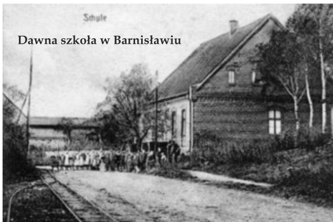
Dawna szkoła w Barniśławiu

Barniśław i okolice stanowią kopalnię wiedzy dla archeologów. Odkryto tu 5 cmentarzysk z epoki brązu, 3 cmentarzyska kultury łużyckiej, w tym jedno kurhanowe. Ponadto zarejestrowano ok. 30 kolejnych stanowisk, datowanych od mezolitu aż po wczesne średniowiecze. Najstarsza wzmianka o istniejącej wsi pochodzi z 1243 roku czyli tego samego roku, w którym Szczecin uzyskał od księcia Barnima I prawa miejskie. Być może właśnie z jego imieniem związana jest pierwotna nazwa wymieniana w źródłach w formie Barnizlaf, później Berenslow, Bernsłow, ostatecznie niemiecka nazwa: Barnimslow - jako forma zgermanizowana nazwy pochodzenia słowiańskiego. Świadectwem tamtych czasów pozostał gotycki kościół z XIII wieku.