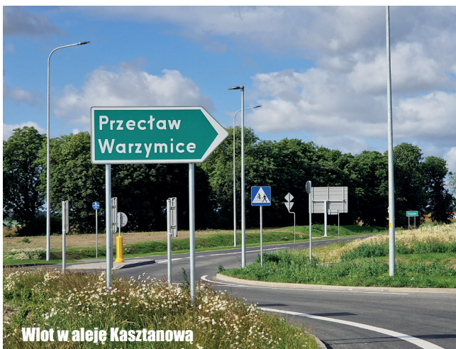
Wlot w aleję Kasztanowa

Prace wykonuje Budimex. Wartość umowy to około 89,5 mln zł.