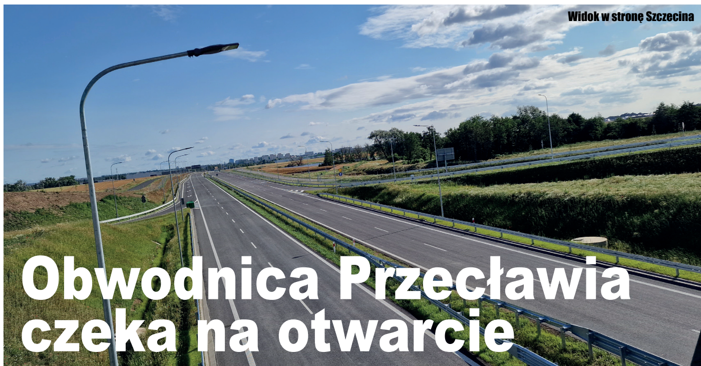
Widok w stronę Szczecina