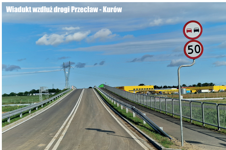
Wiadukt wzdłuż drogi Przeclaw - Kurów